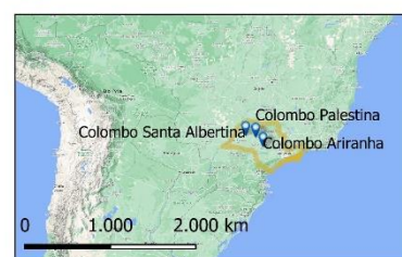
Figura 1: Localização do projeto Elaboração: SITAWI

De modo geral, a performance socioambiental da Colombo Agroindústria e da operação de seus empreendimentos é confortável. Dentre as dimensões avaliadas, destacam-se os seguintes resultados: